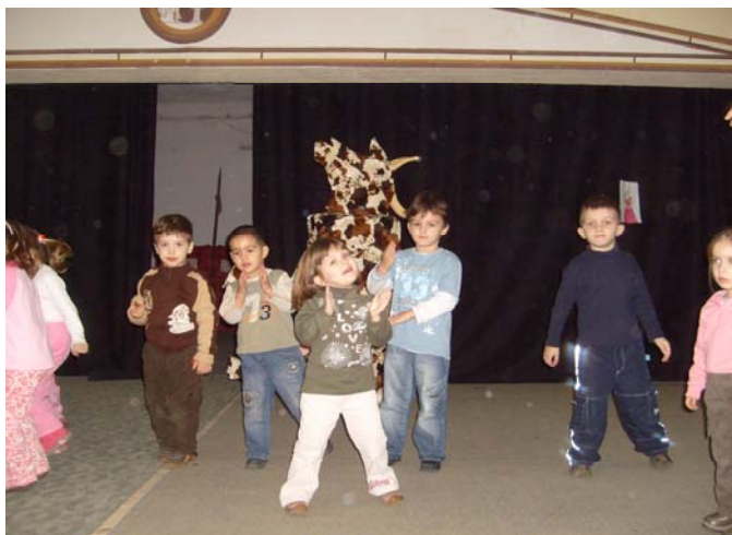
Свакодневне активности на Педагошком факултету

Студентима који су завршили педагошку академију омогућава се похађање посебно организоване припремне наставе до 20% укупног броја часова наставе предмета које полажу.