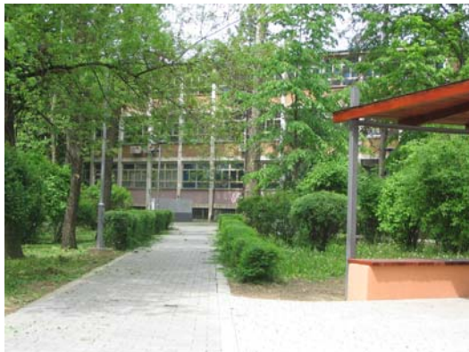
Зграда и парк Факултета

Од школске 2005/2006. године наставни процес се одвија према новим студијским плановима и програмима заснованим на основним начелима Болоњске декларације, а усклађени са плановима и програмима земаља чланица Европске Уније.