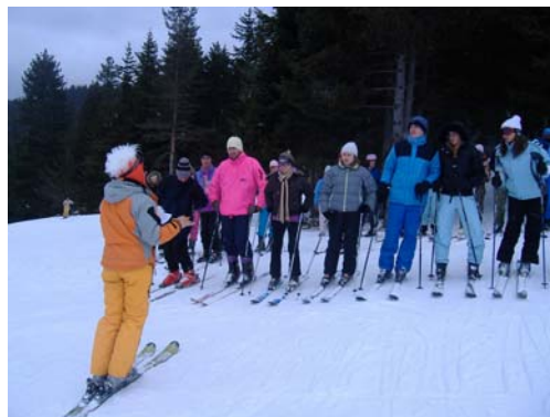
Испити из изборних предмета